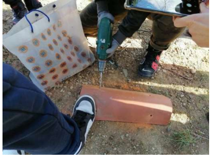
Foratura delle tegole