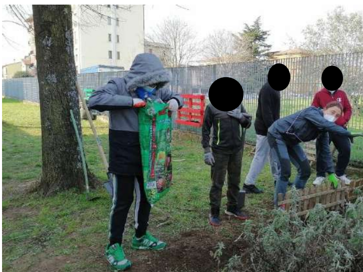
Preparazione del terreno per la semina