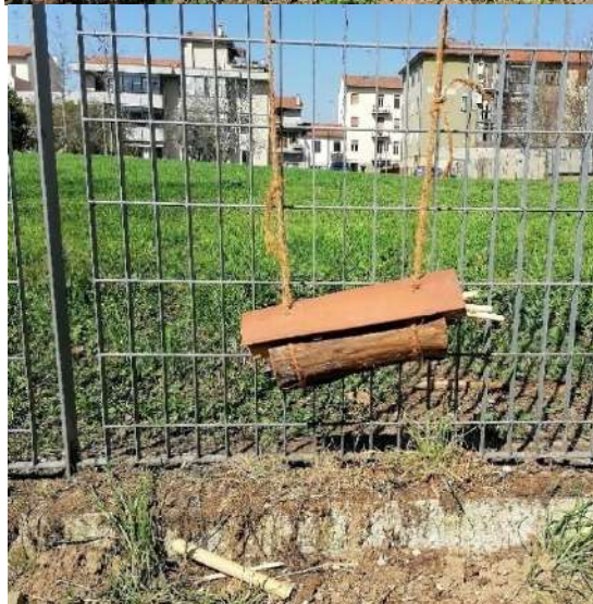
Posizionamento dei mini Bugs Hotel nell'orto della scuola

Il sabato successivo (19 febbraio) abbiamo lavorato in classe al diario di bordo con la professoressa.