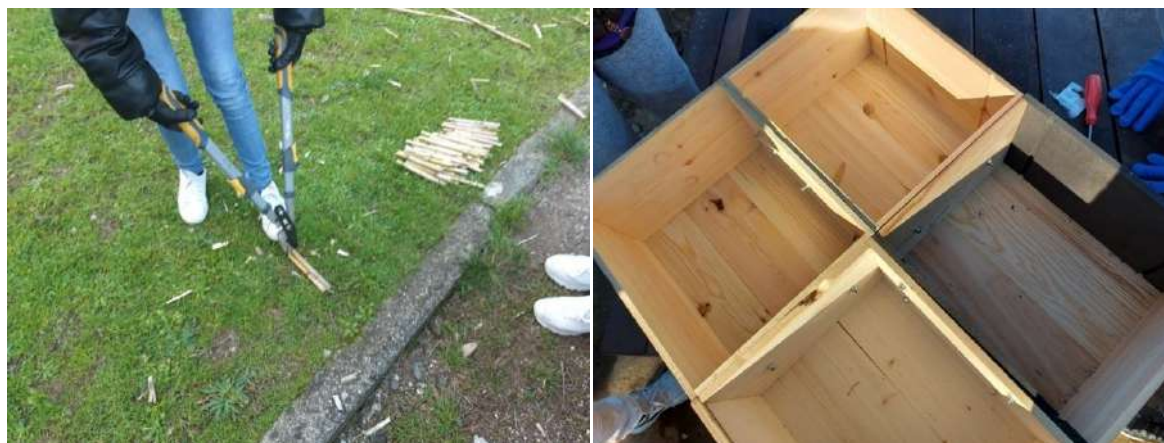
Taglio delle canne di bambù e costruzione della struttura del Bugs Hotel