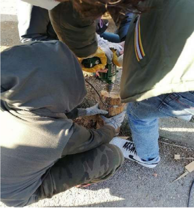
Foratura dei ciocchi di legno