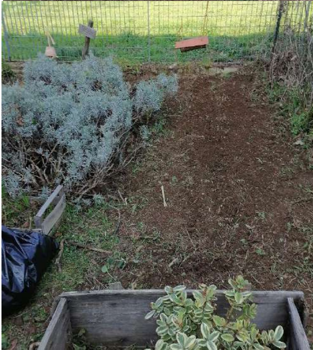
Semina della borragine