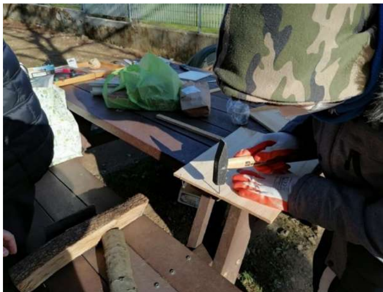
Costruzione del tetto del Bugs Hotel

Il sabato successivo (12 febbraio) un gruppo ha continuato la costruzione del Bugs Hotel con delle divisioni di cartone spesso, un altro gruppo ha costruito dei piccoli bugs hotel con dei vasi di terracotta che poi sono stati posizionati nell'orto della scuola.