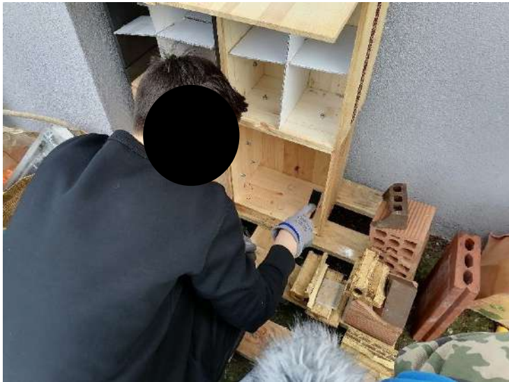
Fasi di riempimento del Bugs Hotel e installazione dei bancali sulla rete della scuola