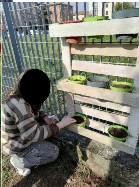
Sistemazione delle piantine nei bancali