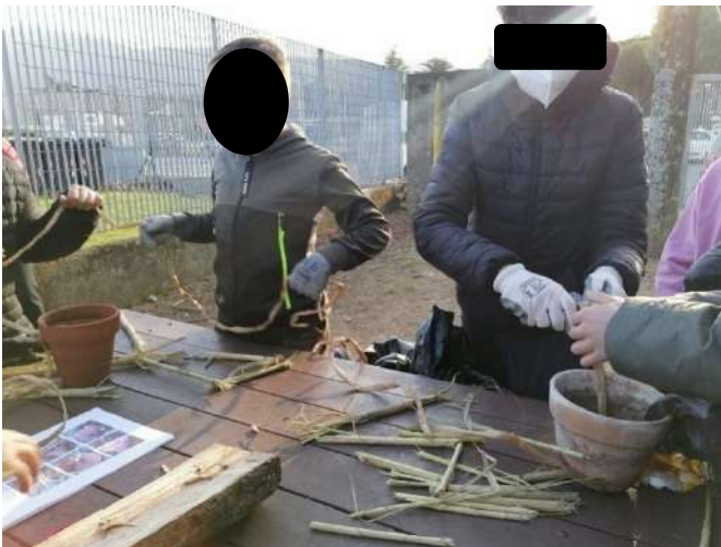
Riempimento dei mini Bugs Hotel