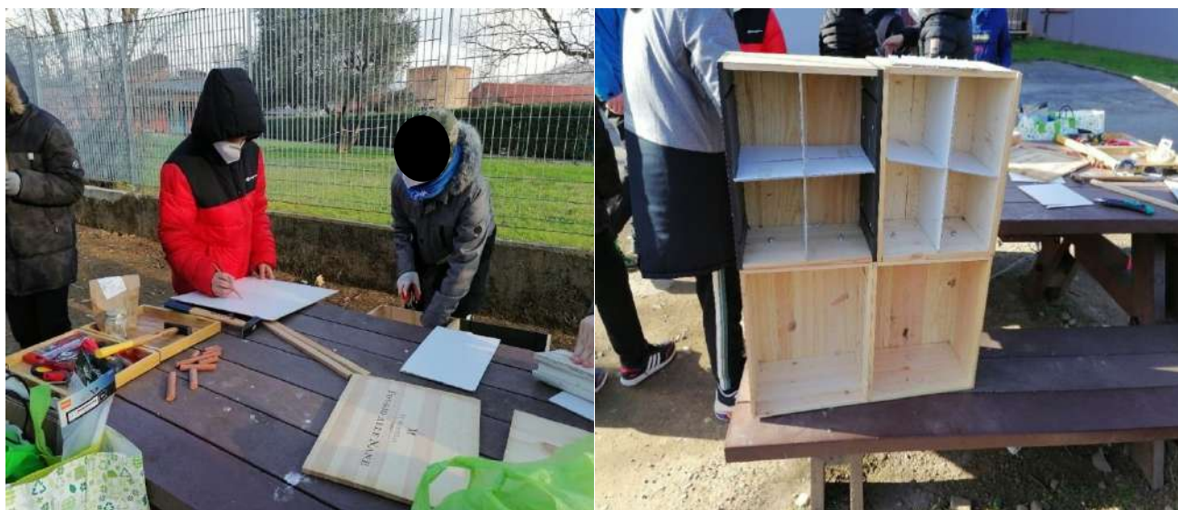
Preparazione del cartone per gli scomparti