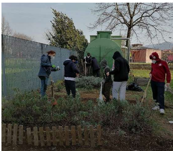
Notare l'albero piegato dal vento che forte e freddo ci ha sempre fatto compagnia!!!