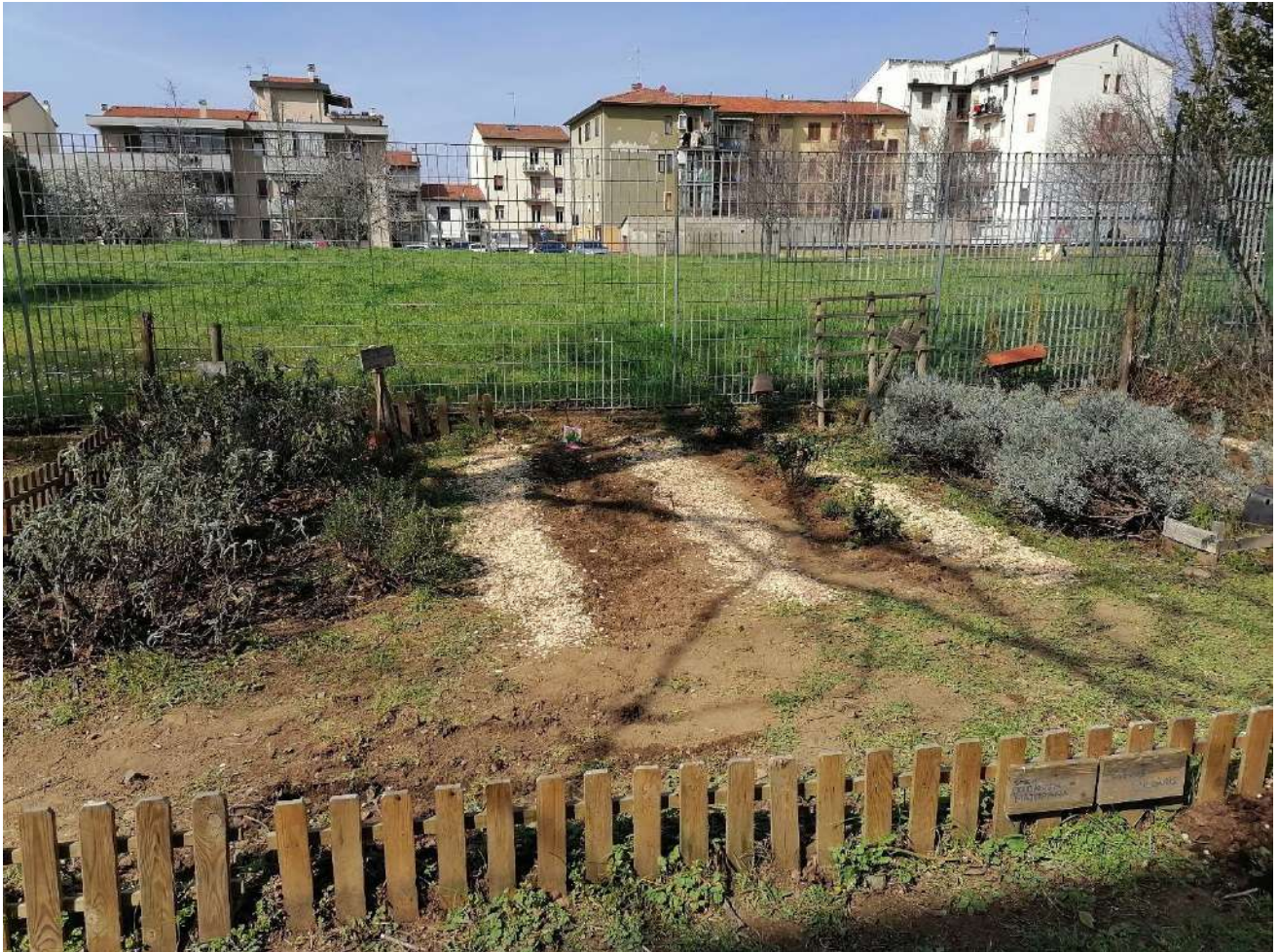
L'orto scolastico risistemato, e con le nuove piante