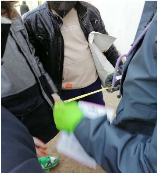
Decisione della misura riguardante la distanza di un seme di borragine dall'altro